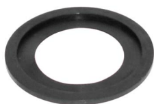
Вакуумная прокладка для Z020