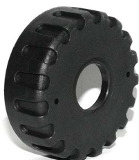
Крышка для Z010 и Z020