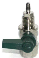
Реверсный кран Z010 и Z020